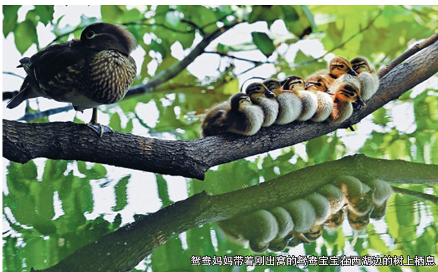
鸳鸯妈妈带着刚出窝的鸳鸯宝宝在西湖边的树上栖息

浙江率先探索全省域及跨省域生态补偿机制,深化绿色发展财政奖补、多元化投融资等,累计兑现奖