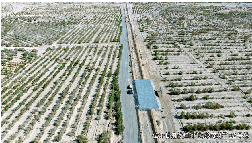
位于甘肃敦煌的“蚂蚁森林”102号林

这些数字背后,是“蚂蚁森林”构建的“环境友好行为—绿色能量—企业捐资—种植养护”闭环:用户的环境友好行为(公交出行、旧物回收、减纸减塑等60多个生活场景)被科学量化为“绿色能量”,积累到一定数值即可“兑换”树苗,