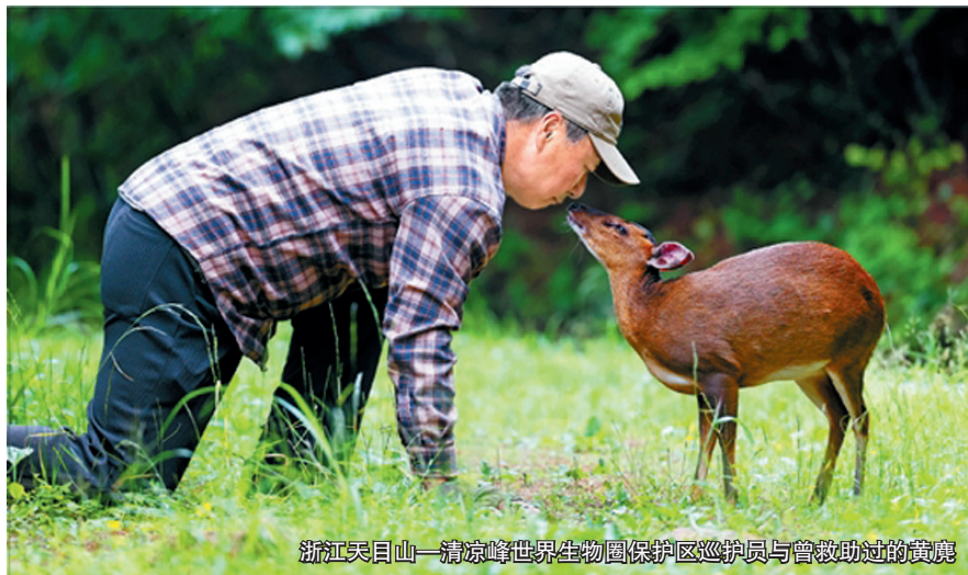
浙江天目山—清凉峰世界生物圈保护区巡护员与曾救助过的黄鹿

强化科技支撑。持续加强生物多样性保护的基础科学和应用技术研究,推进生物育种、生态环境保护等领域研究,着力攻克珍稀濒危物种的繁育(培植)、野外回归