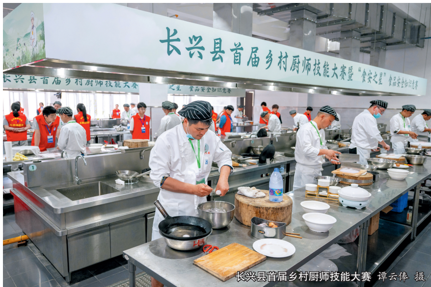
长兴县首届乡村厨师技能大赛

各地热情高涨,积极行动,充分利用文化礼堂、公共服务中心、居家养老中心、村活动室和废弃的村办公楼等场地,对其进行改造或者提升,到2021年底建成3594个农村家宴放心厨房,基本覆盖千人行政村。确因场地限制或因人口