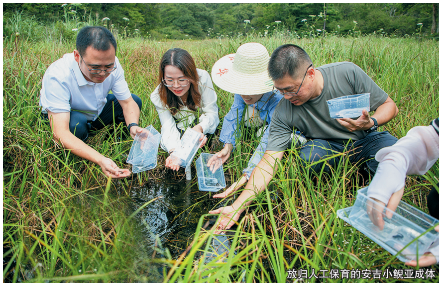
放归人工保育的安吉小鲵亚成体