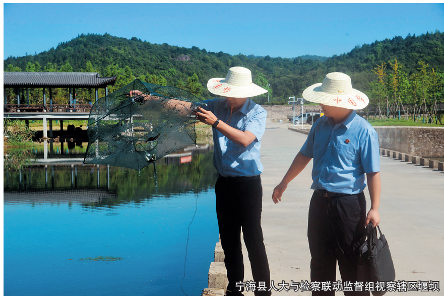
宁海县人大与检察联动监督组视察辖区堰坝

如今的宁波,森林覆盖率保持高位,主要流域水质持续改善,“无废城市”建设稳步推进,更多“生态红利”正转化为民生福祉。这场“司法护绿”行动,不仅守护了绿水青山,更铺就了一条“生态美、产业兴、百姓富”的绿色共富之路。