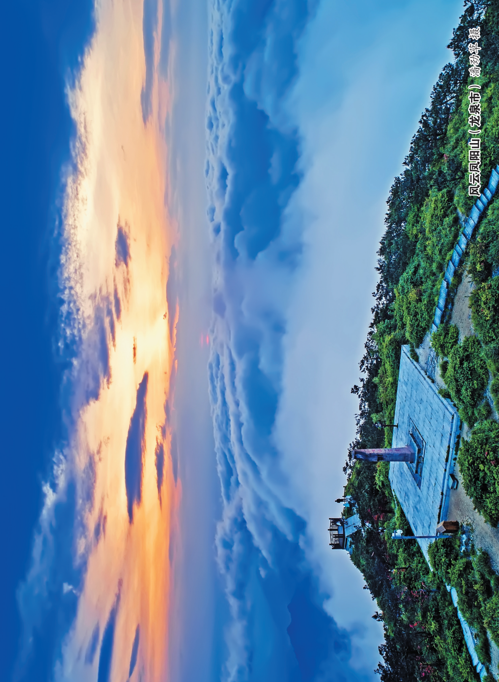
风云凤阳山（龙泉市）