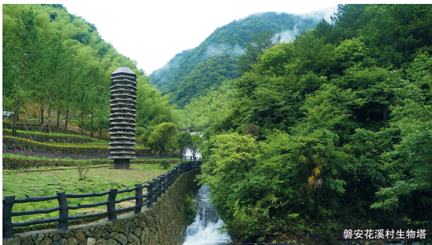
磐安花溪村生物塔