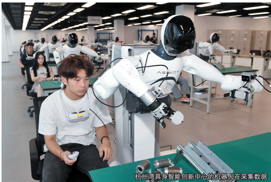
杭州湾具身智能创新中心的机器人在采集数据

同时,围绕“4+4”现代化主导产业发展需要,积极拓展“以才引才”“以赛引才”“文献索才”等,共引育省顶尖人才5名、数量居绍兴市第一,国家级、省级领军人才212名,市级领军人才253名。在“青春