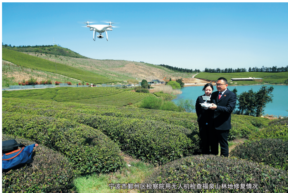
宁波市鄞州区检察院用无人机检查福泉山林地修复情况