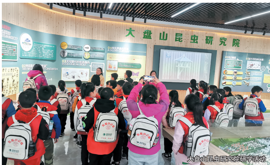
大盘山昆虫研究院研学活动

据悉,磐安县试点的成效做法在联合国《生物多样性公约》第15次缔约方大会、美丽中国建设交流会、地球“一小时”中国区主场活动、习近平生态文明思想浙江论坛等平台展示,获得国内外的广泛关注和认可。