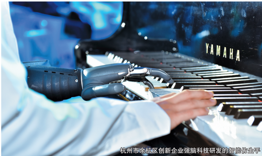
杭州市余杭区创新企业强脑科技研发的智能仿生手

阿里云平台,实现生产数据实时分析,可以将库存周转率提升至行业3倍,订单响应时间甚至缩短至分钟级。