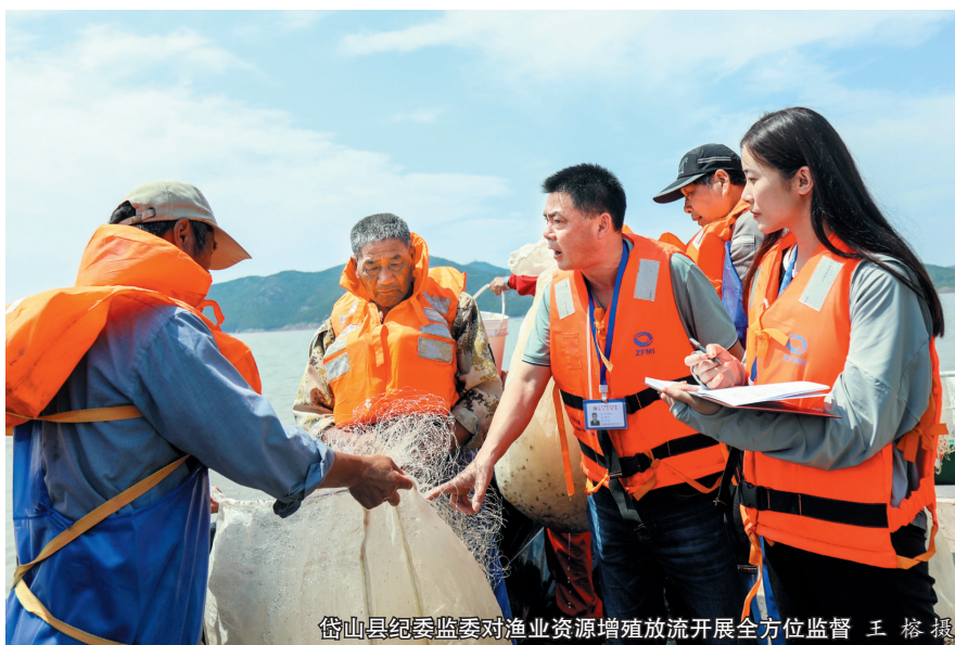
岱山县纪委监委对渔业资源增殖放流开展全方位监督

舟山市纪委监委组建挂牌监督小组,市县联动对“一条鱼”产业链实施挂牌监督。定海区纪委监委建立“室组地企”组团式监督小