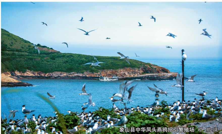
象山县中华凤头燕鸥招引繁殖场

岛绿、滩净、水清、物丰的花岙岛,多年前一度出现海岸侵蚀、沙滩退化、植被破坏、岩体裸露等生态问题。近年来,象山县将花岙岛的生态修复工作纳入《象山县国土空间生态修复专项规划》,积极开展珍稀濒危及特有物种保护、海洋监视监测站点建设等工作。目前,花岙岛自然岸线保有率83.03%,植被覆盖率75.49%。海岛及周边海