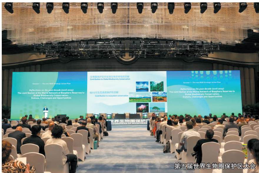
第五届世界生物圈保护区大会

护红线,扎实推进以国家公园为主体的自然保护地体系建设,建成省级以上自然保护区、风景名胜区、森林公园、地质公园、海洋公园、湿地公园等各类自然保护地316个,争创钱江源—百山祖国家公园,拥有天目山—清凉峰、南麂列岛2处世界生物圈保护区,87%的国家重点保护陆生野生动植物物种得到有效保护。