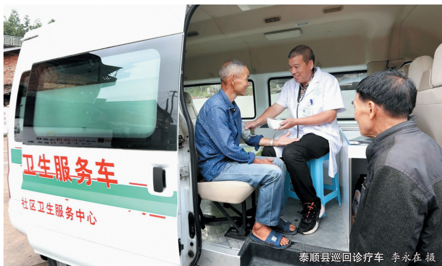
泰顺县巡回诊疗车

在前期对市卫生健康局、市医疗保障局、市人民医院医疗健康集团进行调研的基础上，慈溪市纪委监委派驻第四纪检监察组推动市中西医结合医疗健康集团打造“医共体5G智慧共享药房”，扩充市级与基层两级医院药房的部分紧缺药品目录，实现药类品种“云端共享”，为患者提供“一站式就医购药”服务。