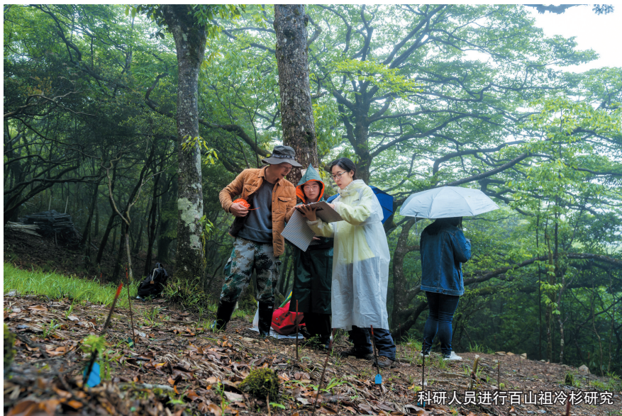
科研人员进行百山祖冷杉研究

百山祖园区被纳入生态保护红线进行管理，实行核心保护区和一般控制区两区管控，严格禁止开发性、生产性建设活动。对此，丽