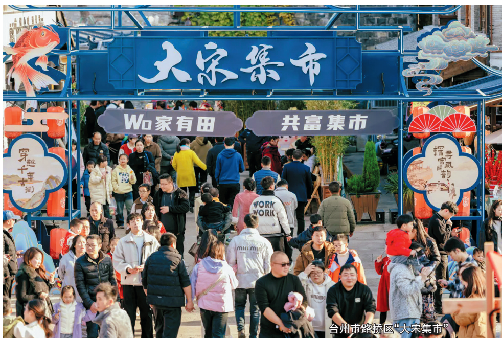
台州市路桥区“大宋集市”