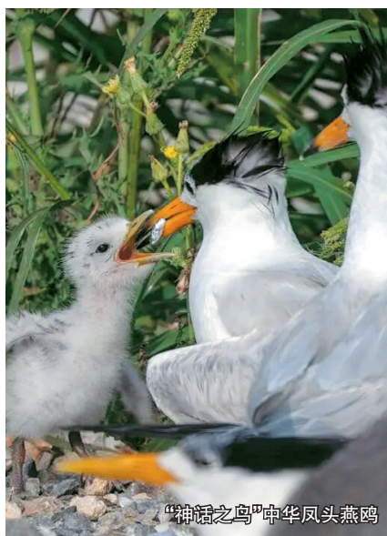
“神话之鸟”中华凤头燕鸥

道”。立足生态优先,严格执行休渔政策,打击非法捕捞,开展生态修复、增殖放流和海洋牧场建设,使野生大黄鱼种群密度恢复至10年前的3—5倍。规范养殖环境,研究出台《南麂生态大黄鱼养殖技术操作规范》,建成2个国家级、11个省级水产健康养殖示范场。