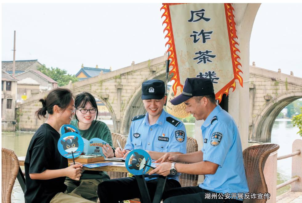
湖州公安开展反诈宣传