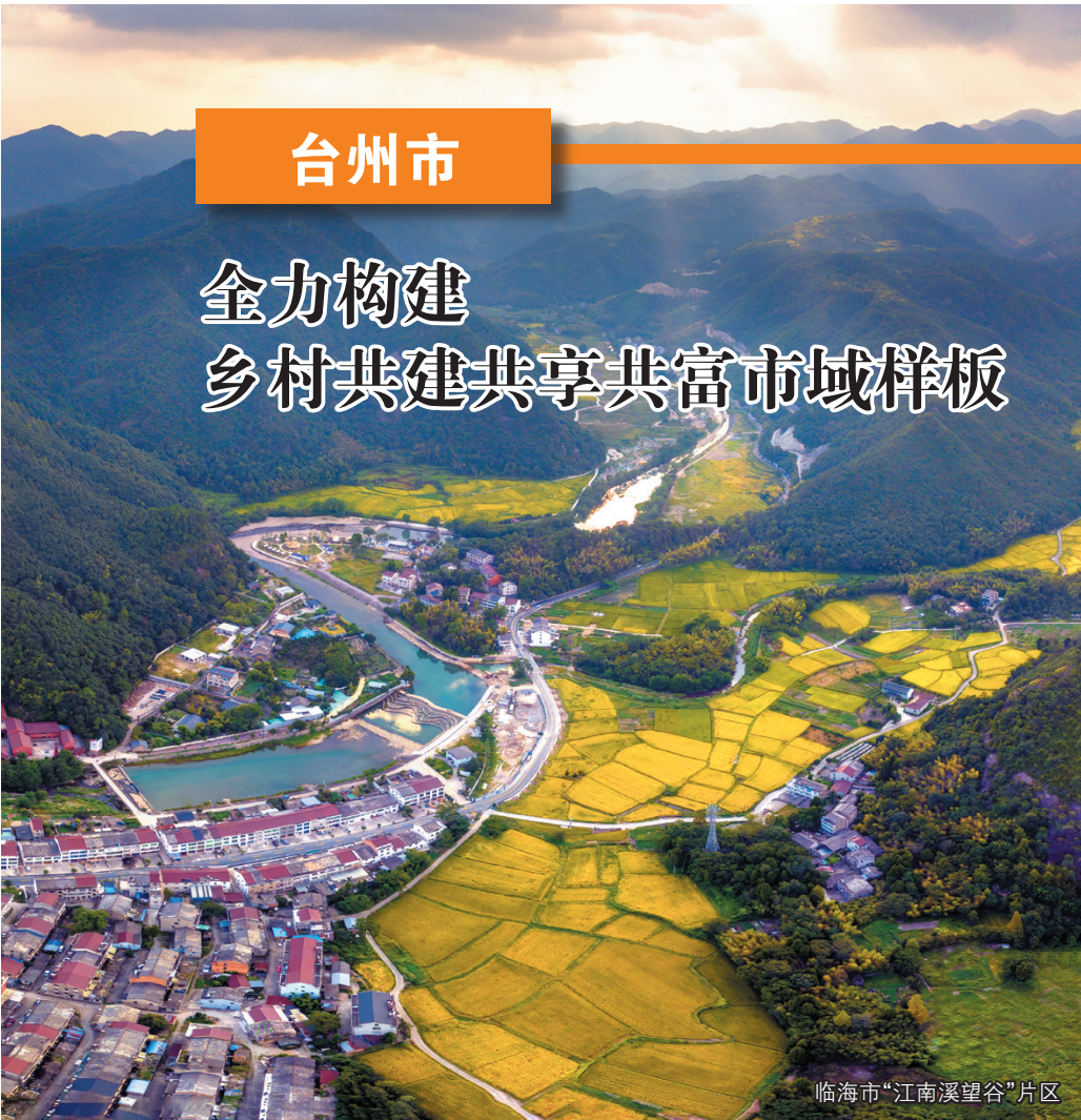
临海市“江南溪望谷”片区