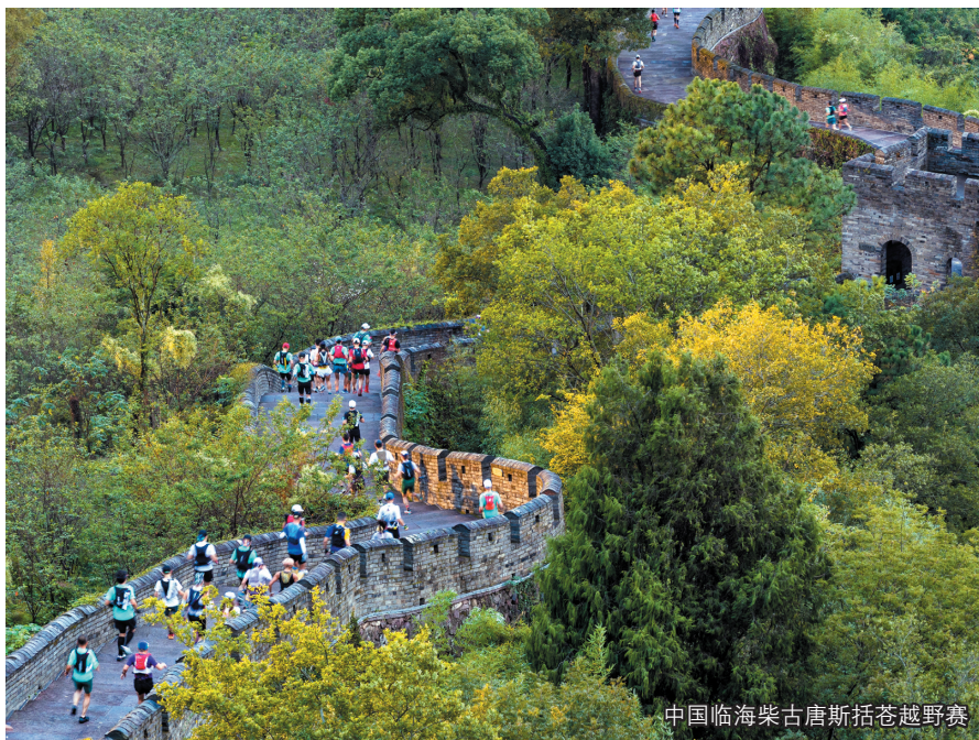
中国临海柴古唐斯括苍越野赛

环视海港,区位优势赋能通道经济,为高质量发展注入澎湃的绿色动能。国开区、综保区、自贸区联动创新区、跨境电商综试区和RCEP高水平开放合作示范区相互叠加,公铁水空“四位一体”的交通网基本成型,海港、保税港、陆港协同开放。在此背景下,临海市探索绿色发展大动作不断:台州湾经济开发