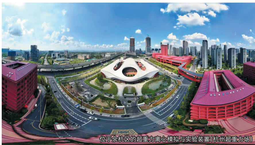
位于余杭区的超重力离心模拟与实验装置(杭州超重力场)

前三季度,余杭区社会消费品零售总额增长11.0%,通过以旧换新补贴资金撬动相关领域消费超120亿元。