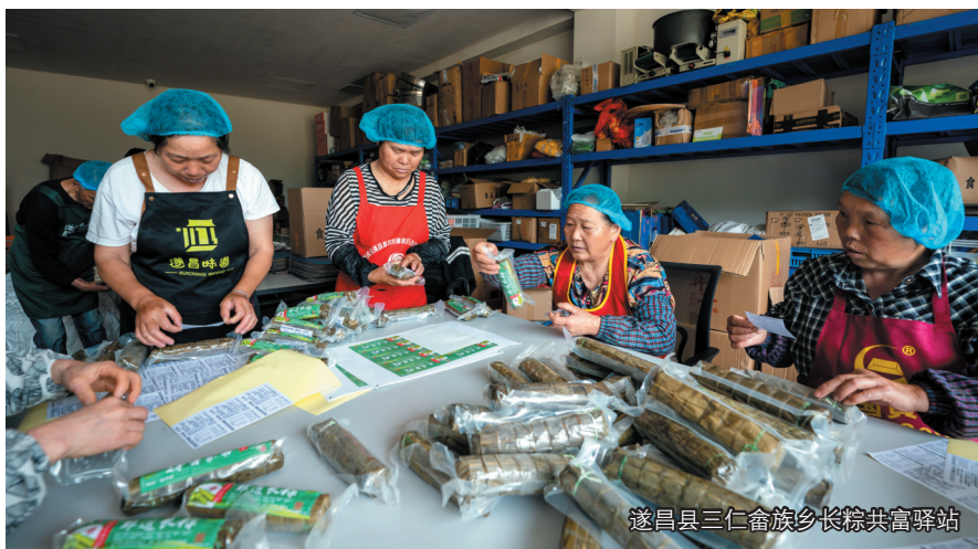
遂昌县三仁畲族长粽共富驿站

立足新阶段,遂昌县将持续优化服务机制、拓宽共富路径,推动共富工坊与绿水青山深度融合,进一步增强其产业带动能力与就业吸纳功能,让产业发展成果更好惠及城乡居民。