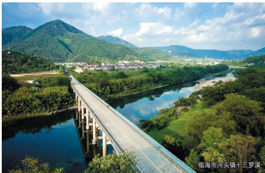
临海市河头镇十三罗溪