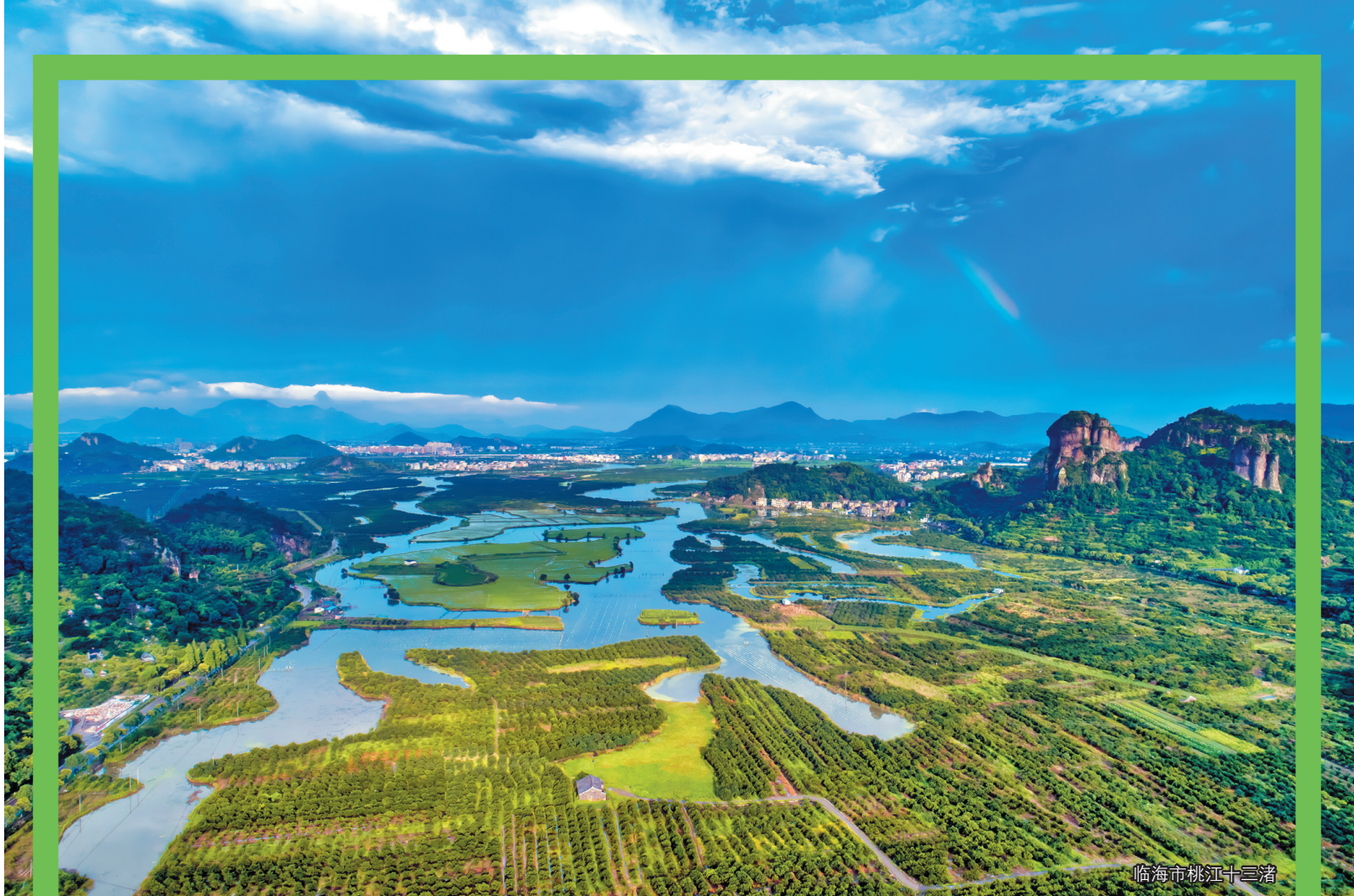
临海市桃江十三渚