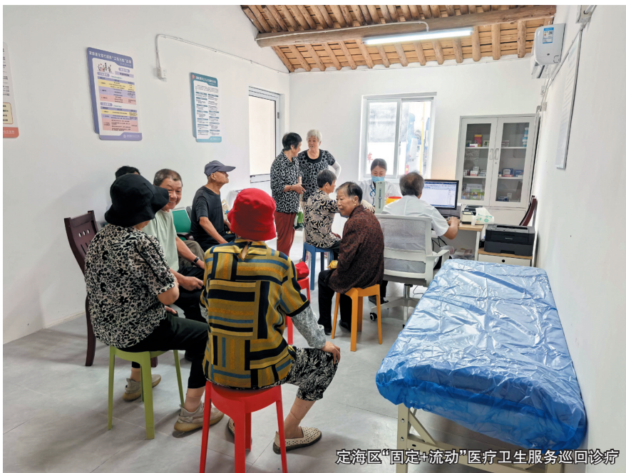
定海区“固定+流动”医疗卫生服务巡回诊疗

因“岛多分散”，定海区的公共服务曾难以触达。当地以“人口向大岛聚、服务随人口走”的思路，扎