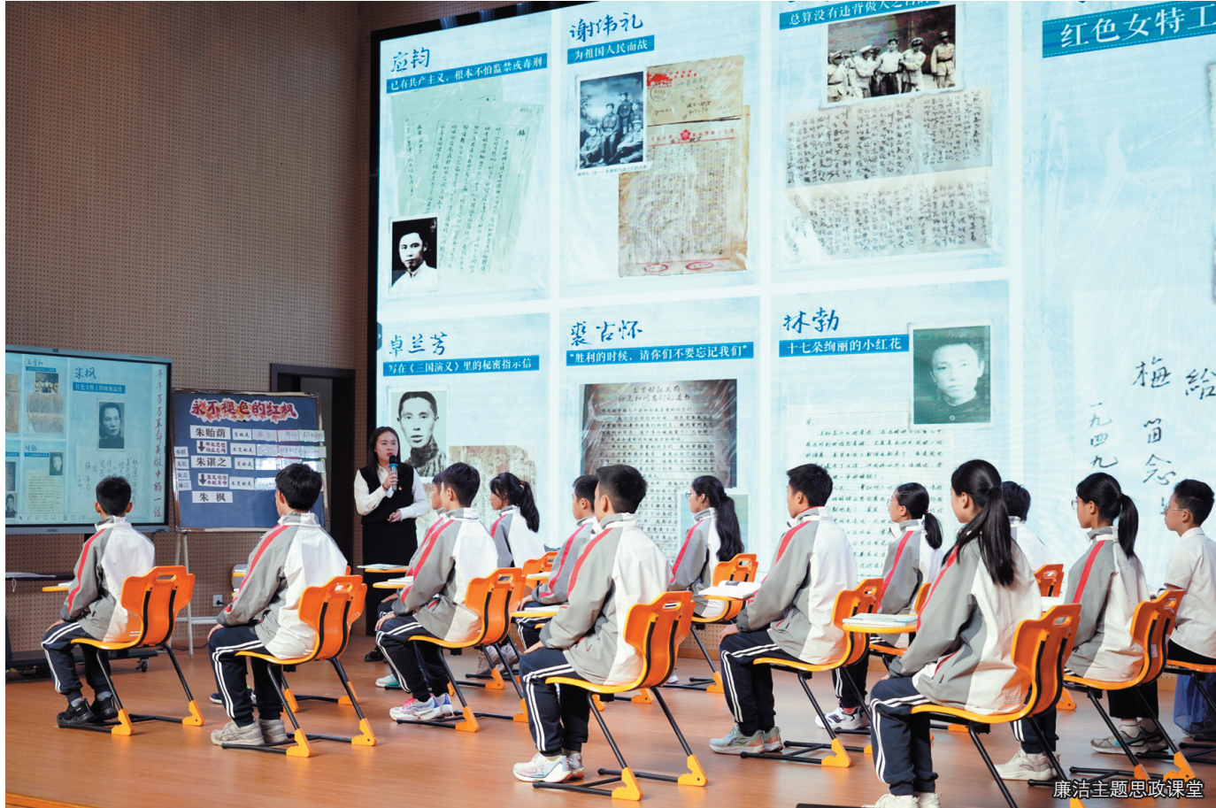
廉洁主题思政课堂

洁文化建设成效转化。同时，构建“核心阵地+周边联动”的红廉教育矩阵，以朱枫烈士纪念楼为枢纽，联动威远清风廉洁文化教育基地、镇海口海防历史纪念馆等阵地，带动周边廉洁文化阵地访客量同比增长10%，短短一月内承接各类团队102个，累计访客破万人次。