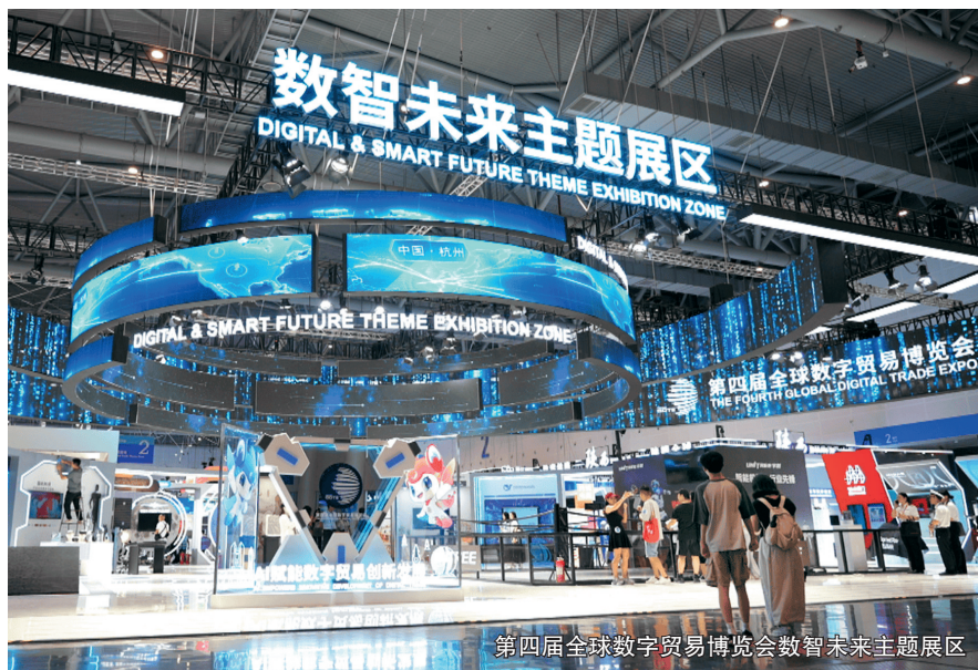
第四届全球数字贸易博览会数智未来主题展区

着力提高安全防护意识。引导全民积极参与国家网络安全宣传周、“网络安全进社区”等活动,通过举办专题讲座和培训班、制作印发宣传册、线上视频宣讲等方式,提高全民个人信息和隐私保护意识。统筹开展“清朗”“之江净网”“浙E执法”等专项行动,依法依规处置违法违规网站、平台、账号等,筑牢网络安全和数据安全屏障。