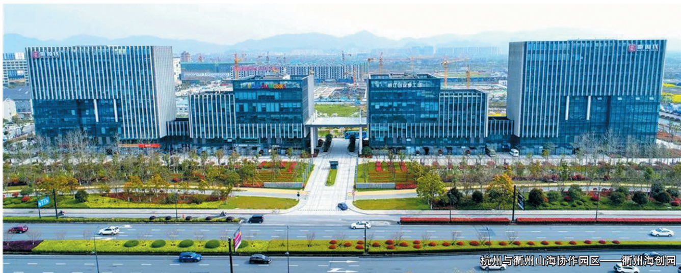
杭州与衢州山海协作园区——衢州海创园