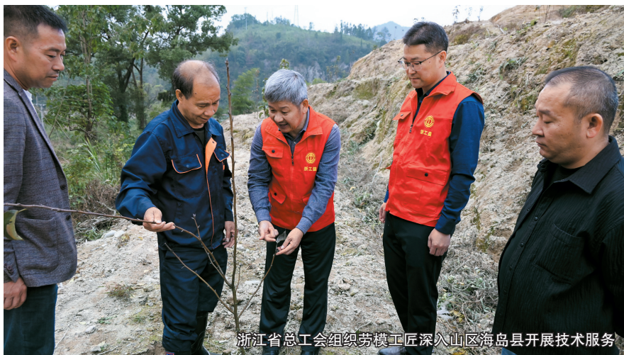
浙江省总工会组织劳模工匠深入山区海岛县开展技术服务

今年以来,全省共有5056位劳模工匠参与助企行动,帮助企业解决3100个难题;为山区海岛县培训了3200多名特色产业工人,锻造了一支扎根山区海岛的技能队伍。