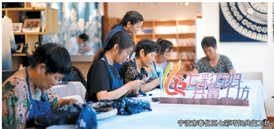
宁波市奉化区七彩巧姐共富工坊