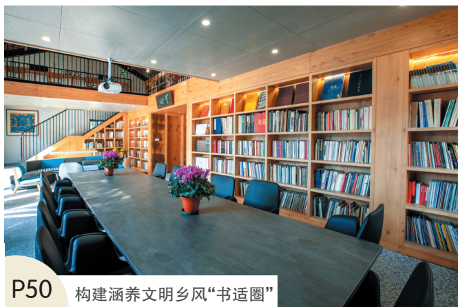
P50 构建涵养文明乡风“书适圈”