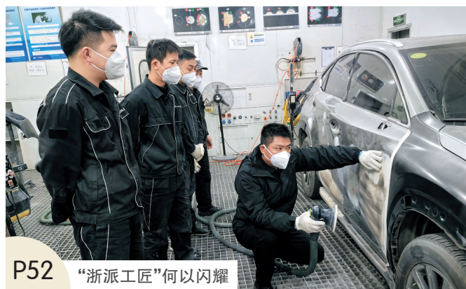
P52 “浙派工匠”何以闪耀

中共秀洲区委 秀洲区人民政府 中共嘉善县委 嘉善县人民政府 中共海盐县委 海盐县人民政府 中共越城区委 越城区人民政府 中共柯桥区委 柯桥区人民政府 中共上虞区委 上虞区人民政府 中共诸暨市委 诸暨市人民政府 中共嵊州市委 嵊州市人民政府 中共婺城区委 婺城区人民政府 中共东阳市委 东阳市人民政府