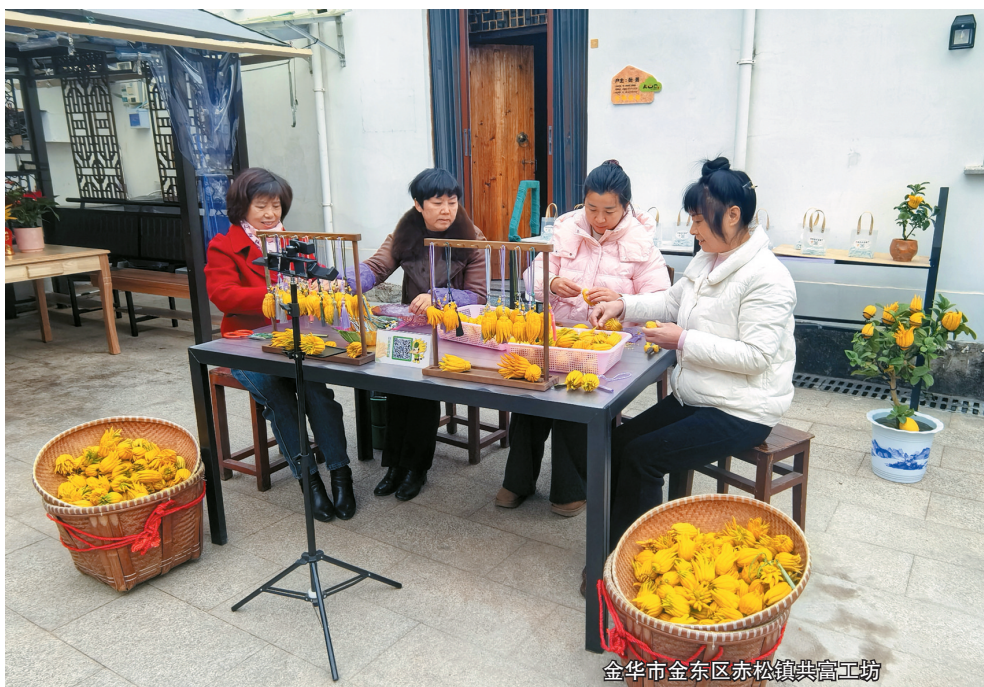
金华市金东区赤松镇共富工坊