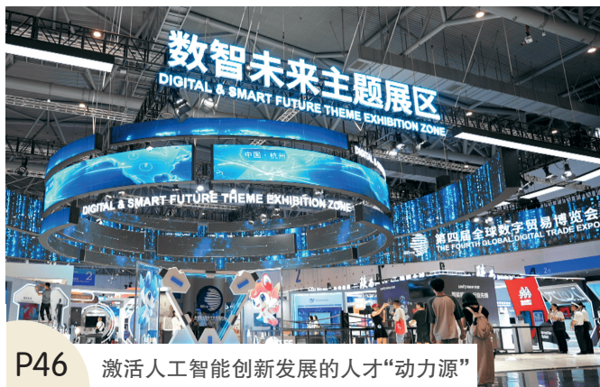
P46 激活人工智能创新发展的人才“动力源”