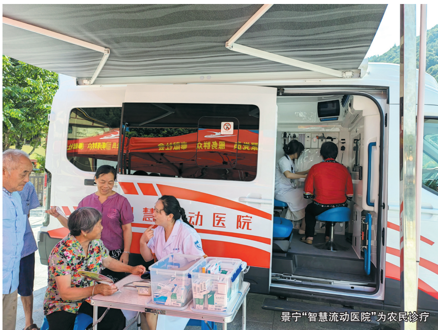
景宁“智慧流动医院”为农民诊疗