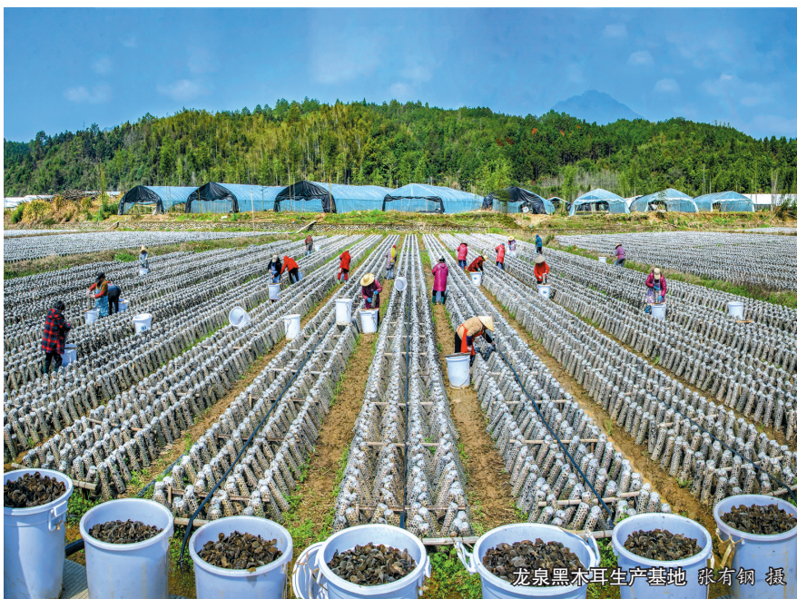
龙泉黑木耳生产基地

拓空间,城市骨架全面拉开。“东拓、西进、南优、北连、中兴”空间战略深入实施,武潭临江、火车站前商贸区、“河山田”生态融合示范区、棋盘山城市中央公园等五大城市组团开发一体推进,全面拓宽了城市开发边界……如今,城市建成区面积从 15.6 平方公里规划拓展至 26.1 平方公里,相当于“再造