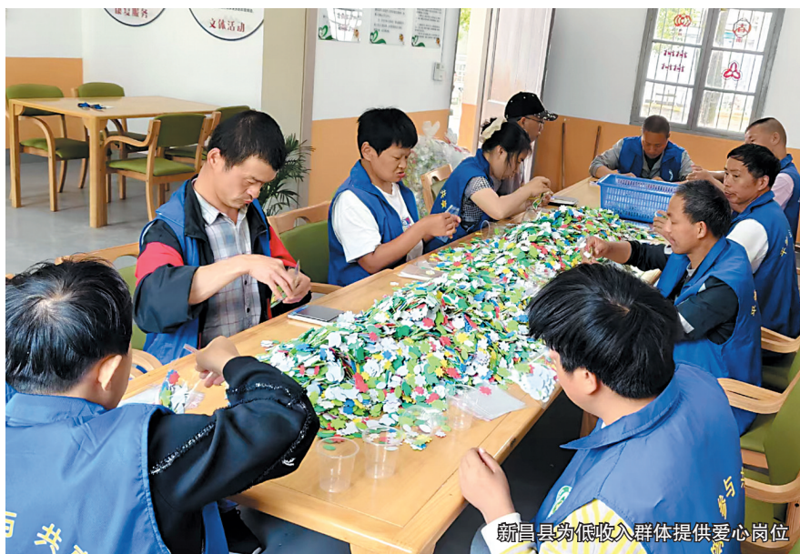
新昌县为低收入群体提供爱心岗位