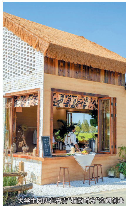
大学生团队在安吉“稻韵时光”空间创业

实践探索表明,青年与乡村的“双向奔赴”是相互滋养、相互成就的过程。浙江推动青年在乡村大施所能、大展其才、大显身手,全面激荡起乡村振兴的“源头活水”,率先走出一条以青年入乡创业就业促进城乡融合发展的新路径。