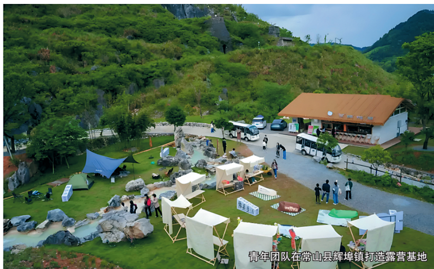
青年团队在常山县辉埠镇打造露营地