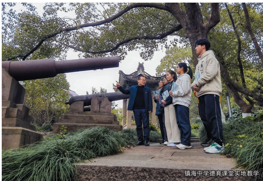
镇海中学德育课堂实地教学

镇海区纪委监委同步编撰《威远清风 梓荫廉韵》廉洁教育读本，以区内18处文物古迹、在此研学工作的先贤先烈为线索，讲述有温度和深度的动人故事，充分释放红廉