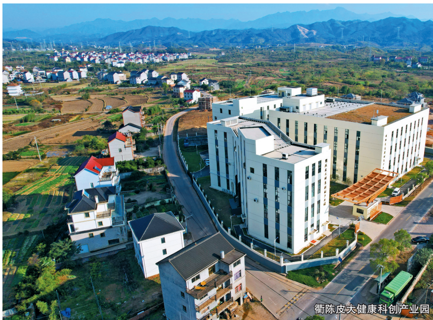
衢陈皮大健康科创产业园