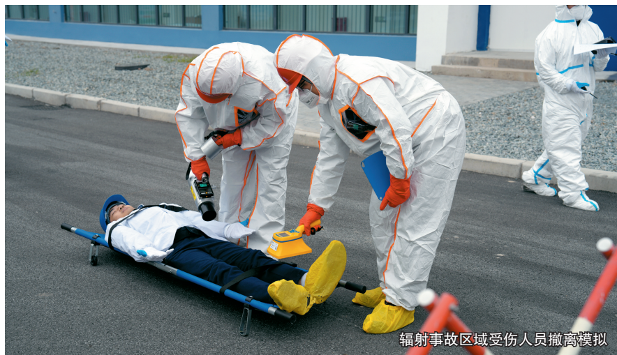
辐射事故区域受伤人员撤离模拟

下一步,浙江将继续以演习试点为契机,总结经验、查漏补缺,积极借鉴兄弟省市的好经验、好做法,持续提升演习“实战化、数字化、规范化”水平,在全国辐射事故实战化应急演练模式探索中,不断贡献浙江经验、展现浙江担当。