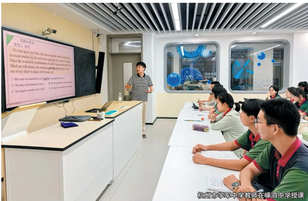
杭州市学军中学教师在嵊泗中学授课

新潮澎湃起,扬帆正当时。在新的起点上,浙江围绕“富民”,一体推进“强城”“兴村”“融合”,这场以缩小“三大差距”为路径,关乎城乡融合、共富先行示范的省域实践,正谱写出“干在实处,走在前列,勇立潮头”的美丽新诗篇!📍