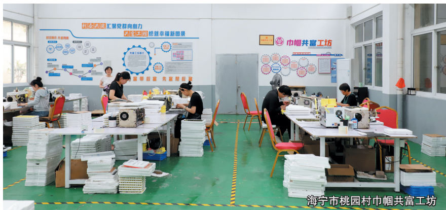
海宁市桃园村巾帼共富工坊

浙江党建引领共富工坊建设,通过“小切口”整合资源、搭建平台、联农带农,有效破解农村发展过程中出现的产业层次较低、产业链条不完善、市场对接不畅、群众增收不明显等问题,具有较好的示范和推广价值。