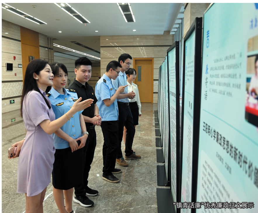
“镇青话廉”优秀廉政征文展示

技艺、制秤、董生阳糕点、髹漆金缮、青瓷等具有本土特色的非遗项目,提炼出“榫卯守矩”“制秤守正”“糕点守洁”“金缮守诚”“青瓷守纯”等关键词,将“规矩、正直、坚守、诚信、纯粹”等廉洁理念融入非遗传承中。通过创建非遗研学阵地、开辟红廉研学线路,让干部和群众在体验非遗技艺的过程中,接受廉洁文