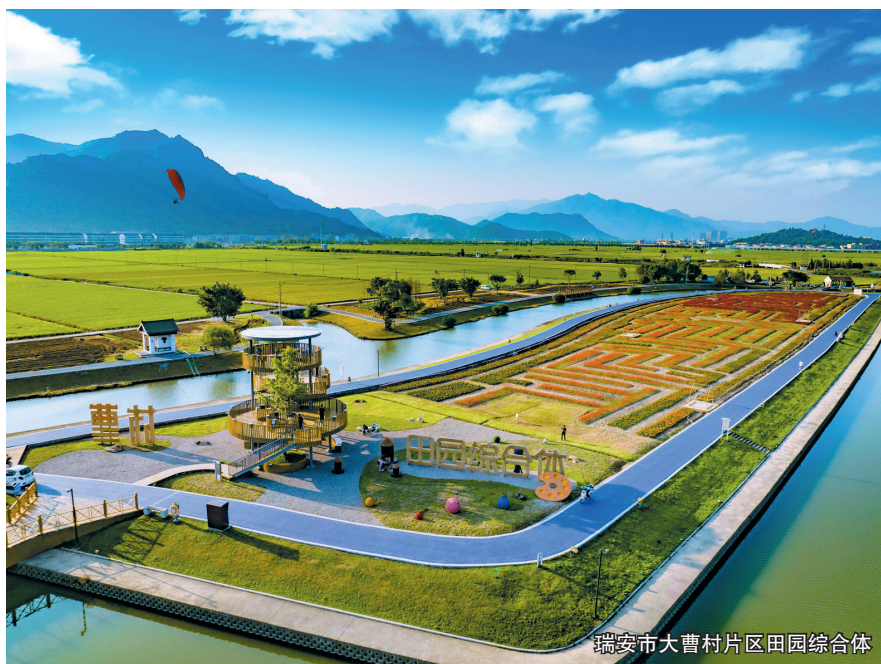
瑞安市大曹村片区田园综合体