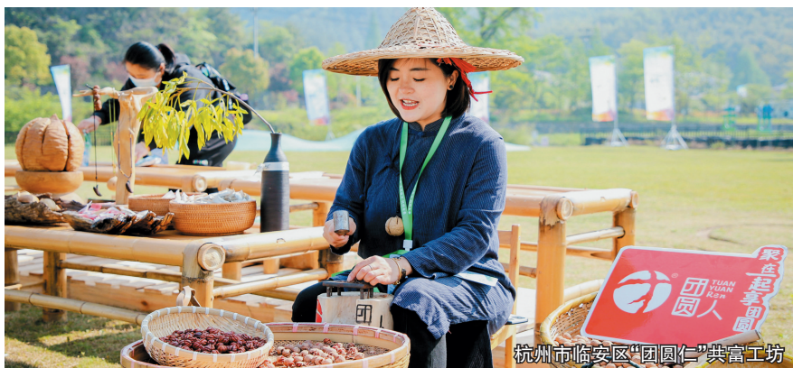
杭州市临安区“团圆仁”共富工坊

近年来,太阳镇围绕“一粒太阳米、一抹生态绿、一条共富路”总体定位,创新“水稻产业+”模式,深入实施科技强农、机械强农“双强