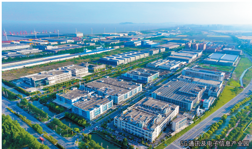
5G通讯及电子信息产业园

正是这种贴心的服务，让外商认准了海盐是“第二故乡”。安费诺集团2017年入驻后，8年5次增资，在海盐开设了4家制造企业，今年产值将突破100亿元。丹佛斯集团20年10次增资，在海盐的企业总数达到15家，总产值超150亿元，海盐有望成为丹佛斯集团全球最大生产制造基地。